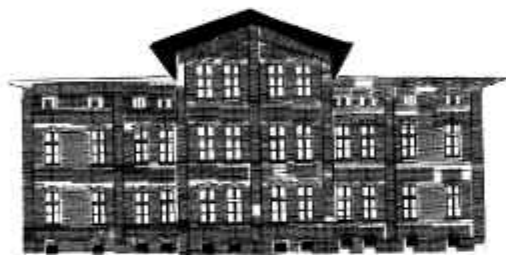
SZOBISZOWICE – UL. PRZEMYSŁOWA

TWOIM ZADANIEM JEST ODNALEZĆ BEBOKA I ODKRYĆ, CZYM MOŻNA BYŁO GO PRZEKUPIĆ, ŻEBY JUŻ NIE DOKAZYWAŁ!