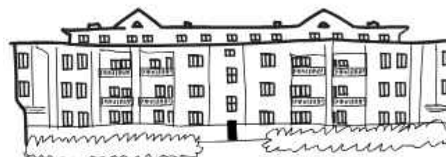
SOŚNICA – KOPALNIA SOSNITZA

POLICZ ILE RZEŻB LWÓW POWSTAŁYCH W KRÓLEWSKIEJ ODLEWNI ŻELIWA, MOŻEMY SPOTKAĆ W GLIWICACH!