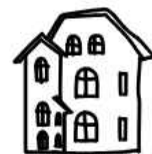
ULICA ROBOTNICZA – PIERWSZE FAMILOKI

POSZUKAJ CHARAKTERYSTYCZNYCH BUDYNKÓW A NASTĘPNIE PRZYJRZYJ SIĘ ICH PARAPETOM – CZY POTRAFISZ ZLOKALIZOWAĆ EMBLEMAT GÓRNICZY?