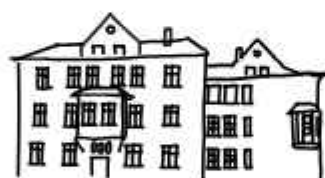
UL. PSZCZYŃSKA – „GLEWITZERGRUBE”

ODWIEDZ OSIEDLE, NA KTÓRYM MIESZKAŁ HORST BIENEK I ZNAJDZ JEGO DAWNY DOM!